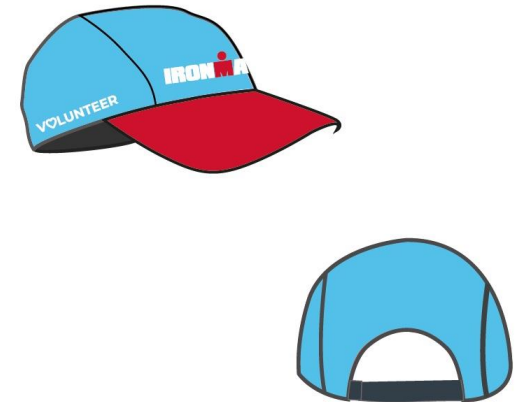
Volunteer Cap 2023