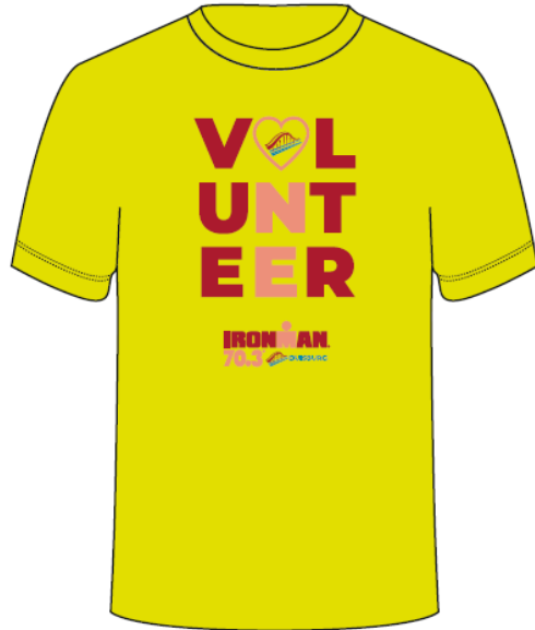
Volunteer Shirt 2023 (Abbildung ähnlich)