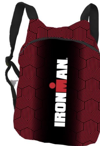
Volunteer Backpack 2023