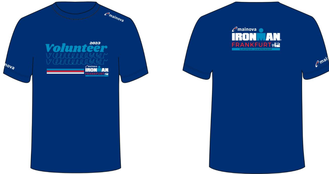
Volunteer Shirt 2023