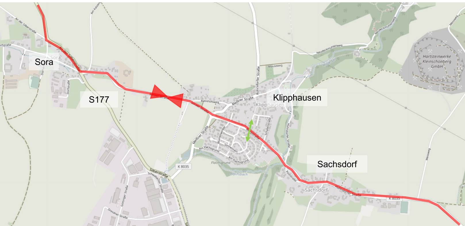
Karte hergestellt aus OpenStreetMap-Daten | Lizenz: Open Database License (ODbL)

Die Triathletinnen und Triathleten durchfahren Klipphausen und Sachsdorf auf der ersten und zweiten Runde. Anlieger*innen der Rennstrecke möchten wir bitten, eventuelle Fahrten möglichst außerhalb der Sperrzeiten zu planen. Beide Orte bleiben über die Meißner Straße bzw. den Sachsdorfer Weg an- und abfahrbar. Sollten Sie während der Sperrung auf Ihr Auto angewiesen sein, empfehlen wir deshalb ein abparken in den Straßen abseits der Rennstrecke mit Anbindung an diese Straßen. An der Kreuzung Sonnenrain / Die Hohle wird die Polizei eine Querungsstelle einrichten. Bei den angegebenen Sperrzeiten handelt es sich um ca. Angaben - Bitte achten Sie aus Sicherheitsgründen auf die Anweisungen des Streckenpersonals und der Polizei.